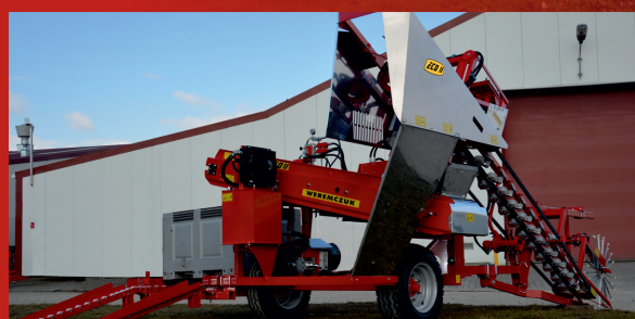
Version with short transporter