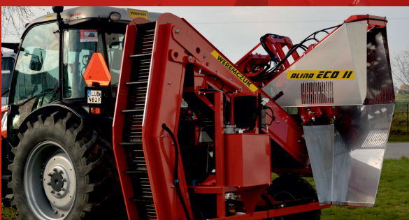
New construction of conveyor