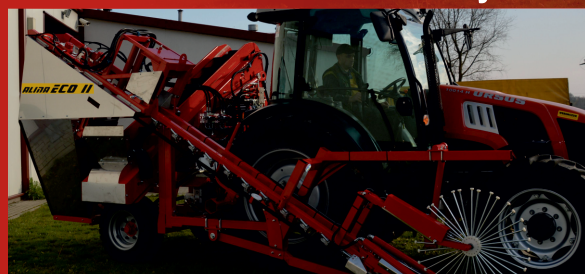
Perfect for small and medium areas