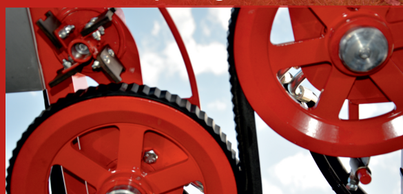
Super-grip profile harvesting belts