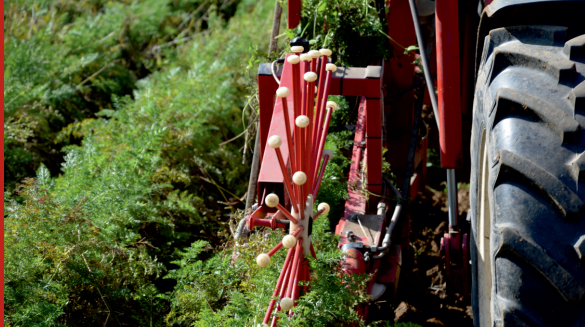
Accurate haulm intake